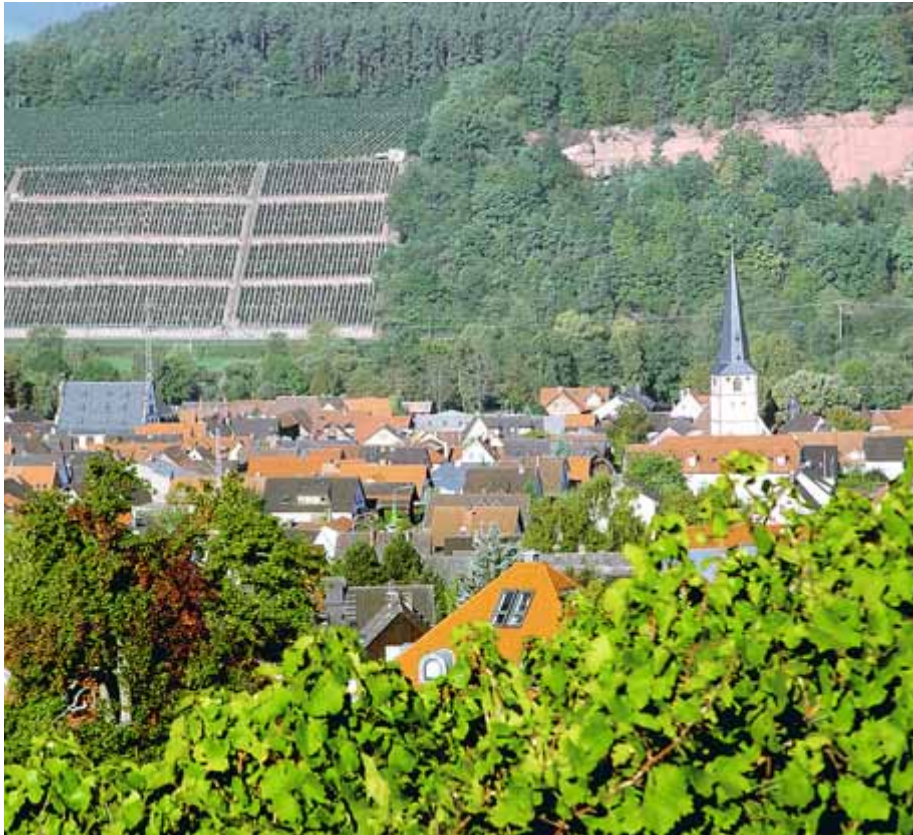
Bürgstadt mit Weinreben und Buntsandsteinbruch