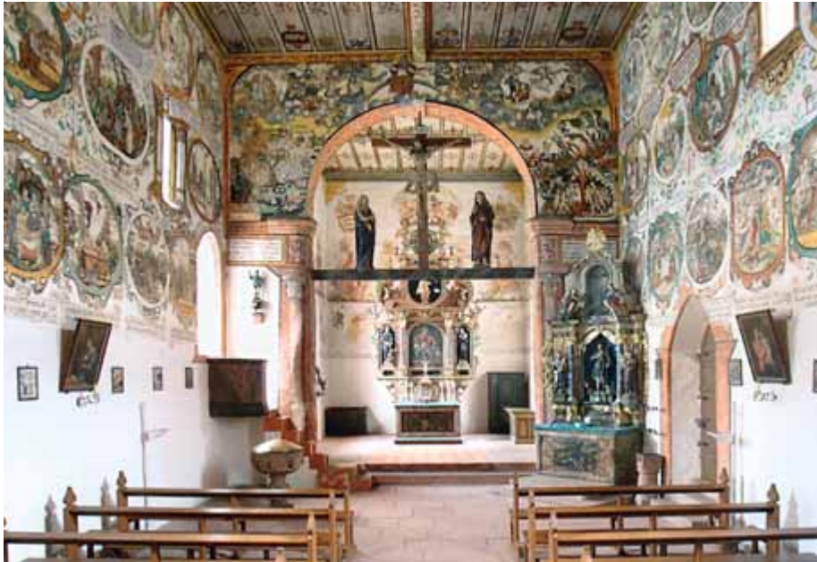
Die Bemalung der Martinskappelle ist außergewöhnlich.

Bürgstadt Wein angebaut. Eine Blüte erreichte der Weinbau vor dem Dreißigjährigen Krieg. Der sich daraus ergebende Wohlstand ließ viele bis heute erhaltene Gebäude (Rathaus 1592), Kunstwerke (Ausmalung Martinskappelle 1598) sowie viele alte Weinkeller unter den Bauernhäusern entstehen. Bürgstadt ist einer der ersten Orte, von denen der Anbau der Rotweinsorte Frühburgunder bekannt ist, die eine bodenständige Rebsorte der Gegend ist.