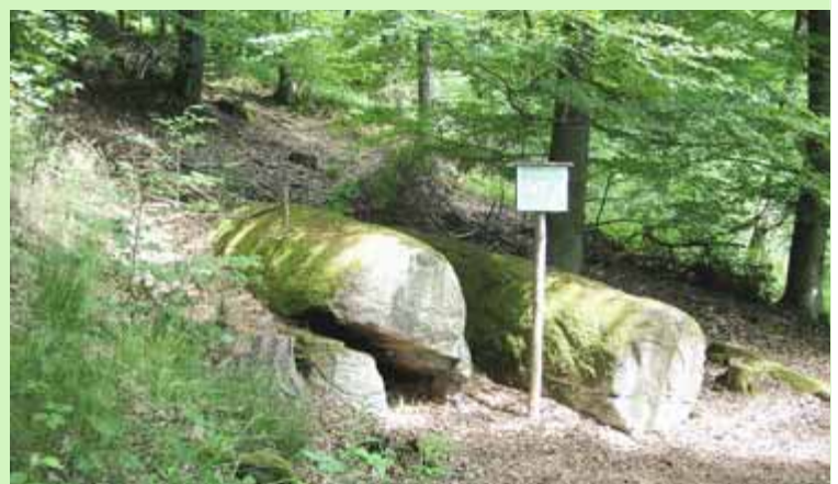
Die »Heunesteine« vom Bürgstädter Wannenberg.

9 Martinskappelle Einzigartig ist die Innenbemalung der Martinskappelle vom Ende des 16. Jahrhunderts mit ihren 40 Medaillons, welche die bebilderte Heilsgeschichte zeigen. Zusammen mit älteren Darstellungen im Altarbereich sind sie ein Juwel der Kirchenkunst der Renaissance des späten 16. Jahrhunderts. Spätestens um 1950 entstanden, war die Martinskappelle vermutlich die erste Pfarrkirche Bürgstadts. Nach mehreren Umbauten verfiel das Gebäude, bis es 1589 bis 1628 wieder hergerichtet und dabei mit den berühmten Fresken ausgestattet wurde.