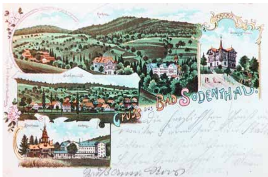
Postkarte aus dem Kurort »Bad Soden« von 1908.