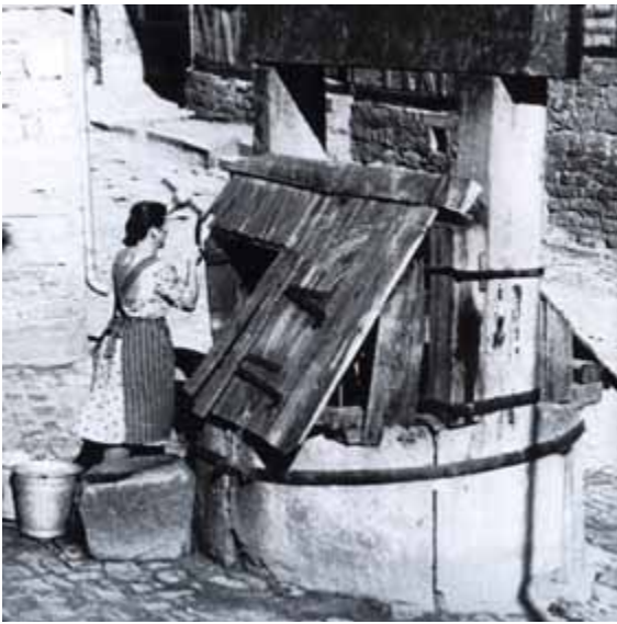
Bis vor 50 Jahren mussten sich die Dornauer ihr Wasser aus dem Brunnen holen.